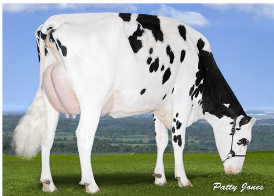
PEAK BOMBERO MAXIMA THIRD DAM